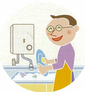
開放燃焼式 ガス瞬間湯沸器